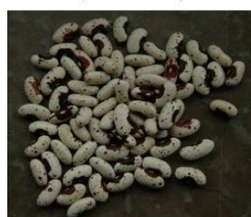
Jacob's cattle bean