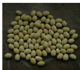
gula böner (citronböna)