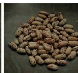
borlotti di lingua